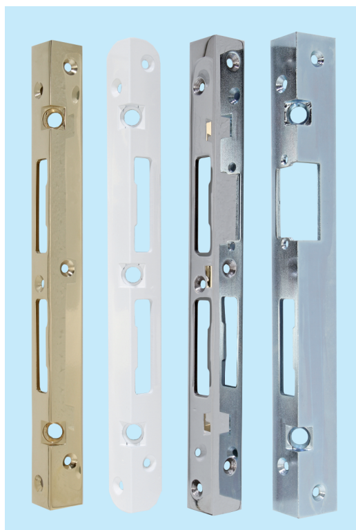
▲ Sicherheitsschließbleche für Hauptschlösser