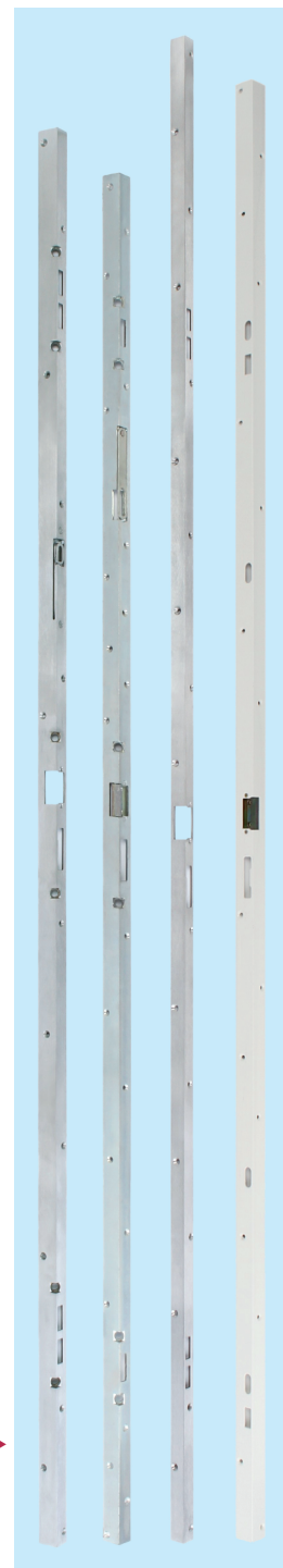
Sicherheitsschließleisten durchgehend ▶ für Mehrfachverriegelung