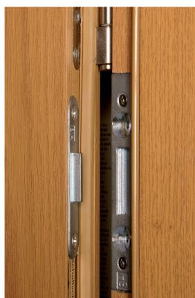
◀ Bandsicherung für die Scharnierseite